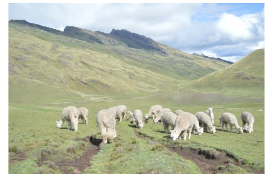
Alpacas. Camélidos andinos en el Pachatusan.