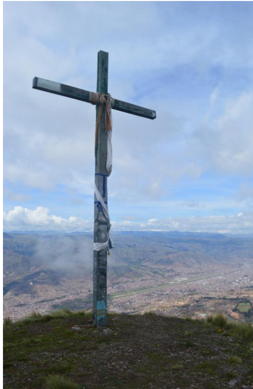
En la cumbre, a, 4345m.s.n.m.