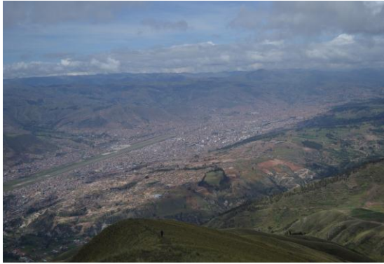
Vistas panorámicas del Valle del Cusco.